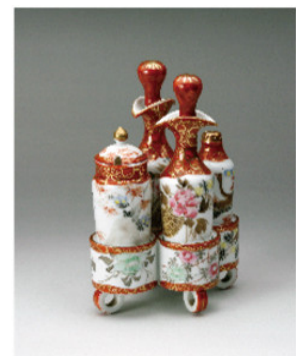
西浦焼上絵磁器 SP セット 多治見市教育委員会所蔵

西浦焼を創始した西浦圓治は同21年(1888)に自宅前の屋敷を上絵付工場に改造し、絵付の腕のあった大岳彦兵衛に工場を経営させました。翌年には一流の絵付工場の多かった名古屋へ移転し、60名ほどの職工で西浦焼を製造しました。この年西浦圓治はパリ万博で銅賞を受賞、その後国内の博覧会などで常に上位入賞を果たしました。