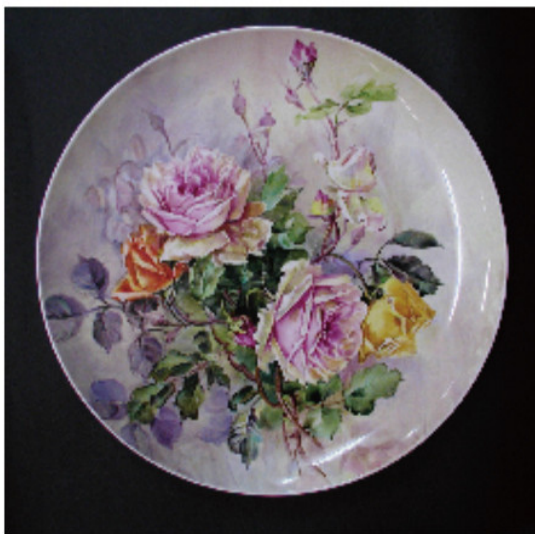
佐分利利成 上絵薔薇絵 16 インチ白磁大皿 多治見市教育委員会所蔵