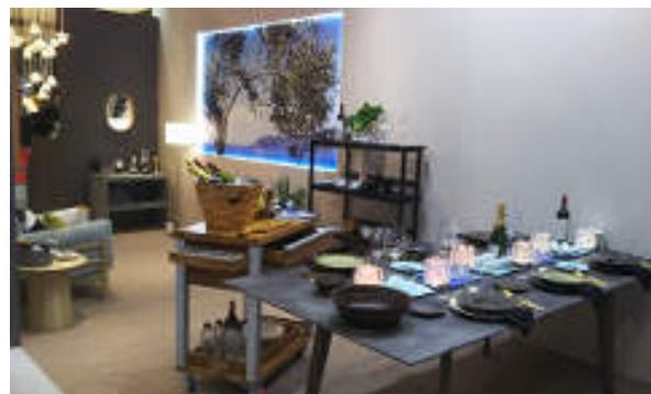
今回のテーマ「リゾートの1シーン」