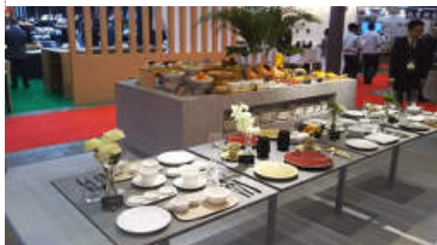
オールデイダイニングとビュッフェスタイルの展開