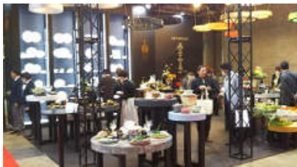
「RAK」ブランドの商品をまとめたコーナー