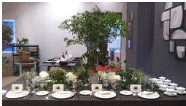
ブライダルをイメージした展開