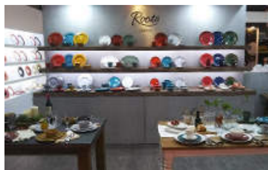
カラーバリエーションが豊富なカジュアル食器