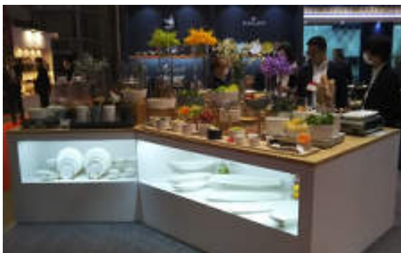
ビュッフェスタイルの展開