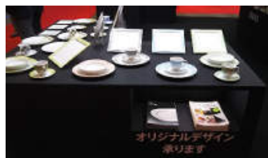
強さと軽さをもとめた強化磁器シリーズ「Oridge」を中心に展開。オリジナルデザインの提案もアピールしていました。