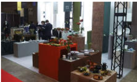
新たに取り扱う輸入洋食器が中心のコーナー