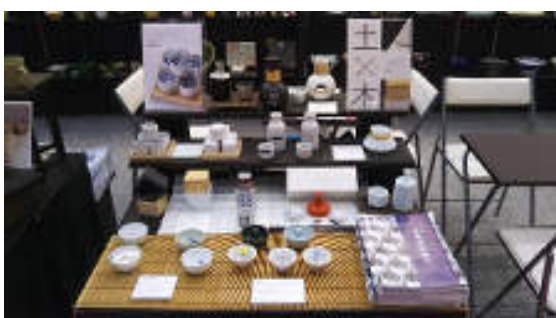
定番シリーズ「居酒屋物語」