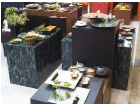
和のテイストを持った商品群で構成された ミヤザキ食器らしい展開