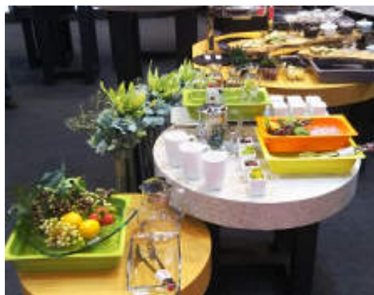
9色のカラーバリエーションで明るく豊かな ビュッフェスタイルの展開