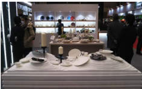
ブライダルをイメージした新商品