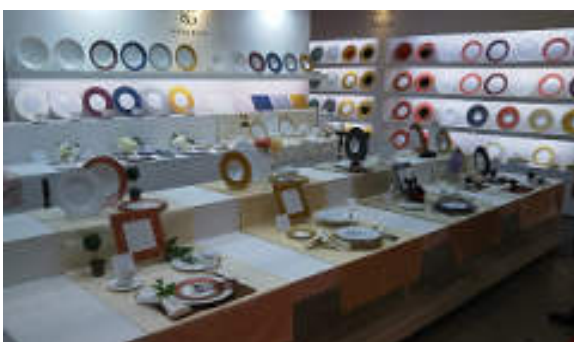
型とカラーバリエーションが豊富な洋食器