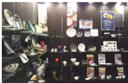
オリジナル食器「荒彫」