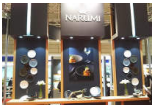
テーマに沿った正面ステージ展開