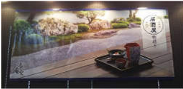
「抹茶」と定番「居酒屋物語り」の提案